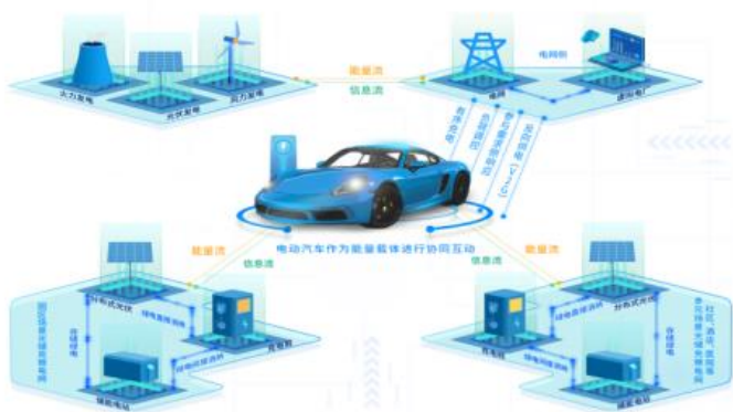
能源互联网的典型场景